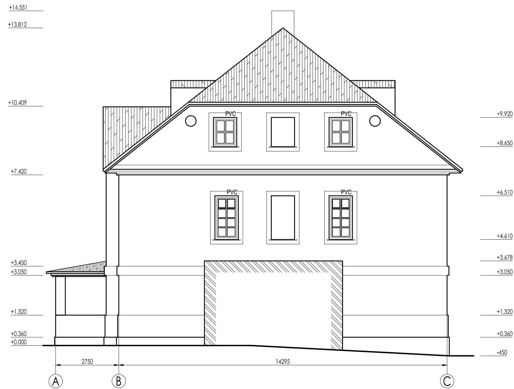
Fasades asis A-C; M 1:100